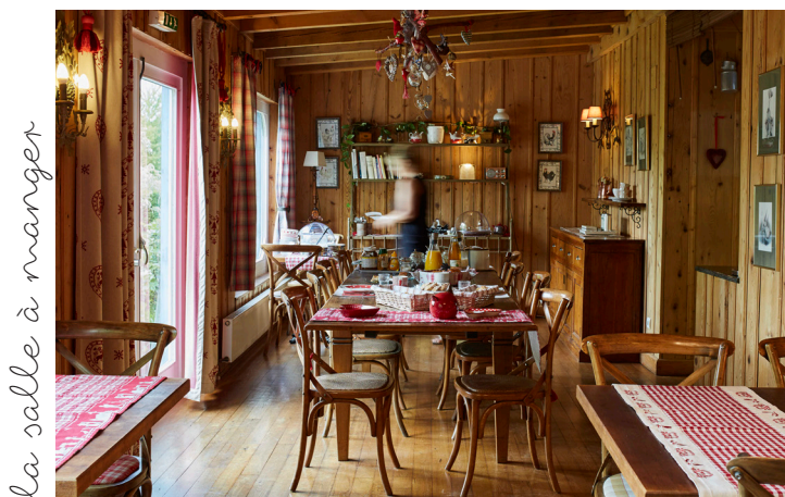
la salle à manger

Nous sommes à votre écoute afin d'organiser votre séminaire sur mesure selon vos attentes et envies